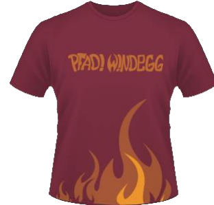
Pfadi Windegg T-Shirt 20 Fr.

Wichtig: Sämtliche Artikel aus dem Pfadi-Shop «Hajk» ( www.hajk.ch ) können über die Materialstelle der Pfadi Windegg günstiger bezogen werden.