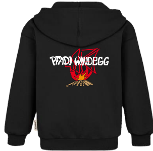
Pfadi Windegg Zip-Pullover 60 Fr.